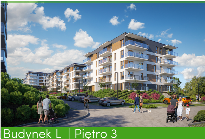
Budynek L | Piętro 3